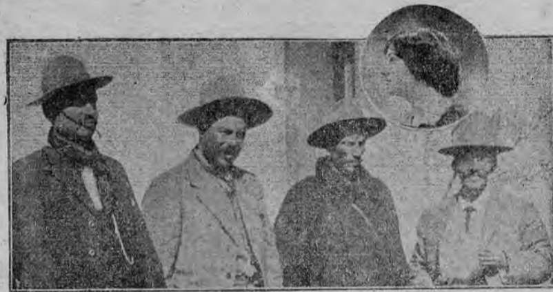
De derecha a izquierda: González Florio, Villa, Ortega (que murió en la batalla en Zacatecas), Ortega y Méndez. En el medallón la esposa de Villa

busto, de semblante atezado por los solotes de su Estado natal, ojos inyectados en sangre, lo que le da un aspecto bravo, y de cabello áspero y espeso. Montado en su corcel de guerra, con su traje típico de charro, el pecho cruzado por dos bandas de tiros, y el 30 x 30 pendiente del arzón, la figura de Villa es imponente. Tostado por el sol y mojado por las lluvias, insensible a las inclemencias del tiempo, soportando lo mismo los ardores del estío que las heladas ráfagas del invierno, aparece a caballo, inmóvil sobre una cumbre peñascosa de la sierra de Chihuahua, como una estatua de bronce animada por una chispa celeste, o un guerrero de granito tallado por un genio en lo alto de una montaña de pórfido. Santos Chocano, en uno de esos arranques que le son familiares, dijo en el Teatro de los Héroes, de Chihuahua, refiriéndose a este hombre singular: "La tierra misma se rasgó las entrañas para dar nacimiento a un tan gran capitán como Francisco Villa".