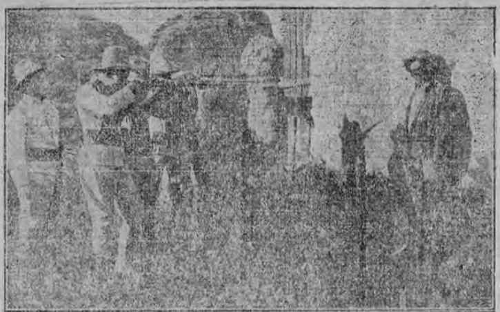
Como se fusilan en México a los jefes traidores

Villa, salvado milagrosamente, encontrábase oculto en los Estados Unidos. Al conocer los detalles de la sangrienta catástrofe y la protesta vigorosa de Carranza, juró castigar al traidor, y con un puñado de hombres apareció en la sierra de Chihuahua. En breve reunió los dispersos soldados del Ejército Libertador, atacó audazmente a Ciudad Juárez, y se apoderó de esta plaza, derrotó a Mercado, y se adueñó de la